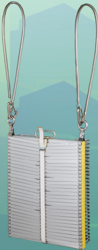
ナスカンフックB型