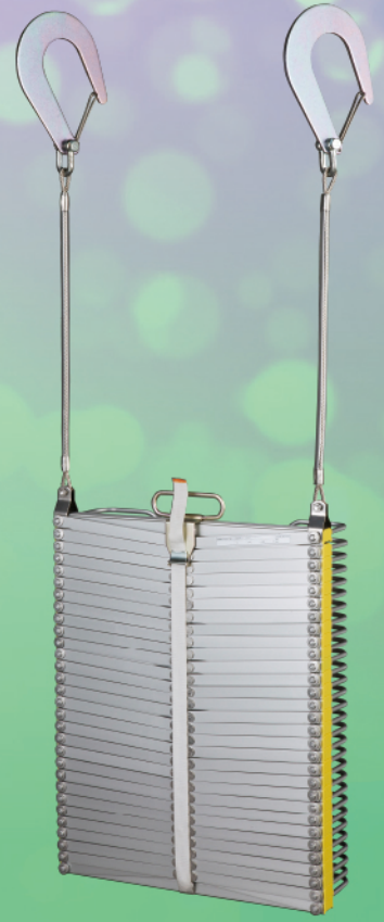
ナスカンフックA型